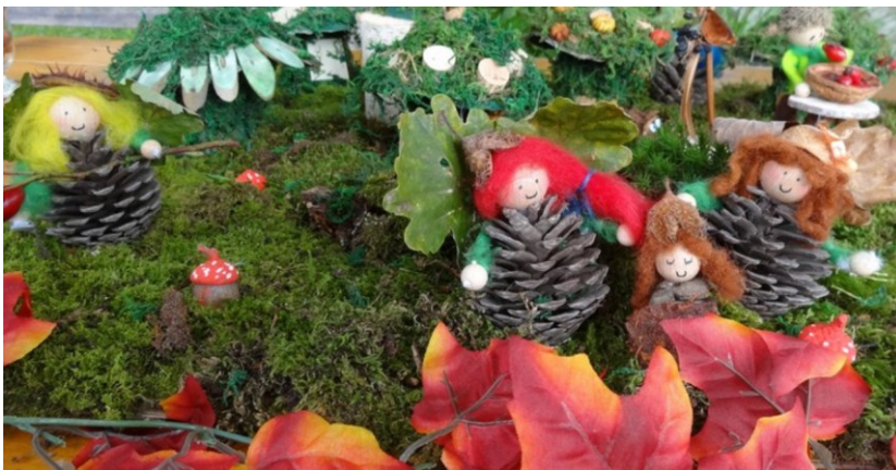
Dežela škratov – pripravili so jo učenci OŠPP