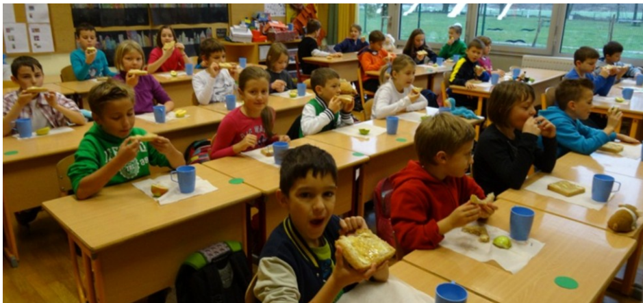
Tradicionalni slovenski zajtrk