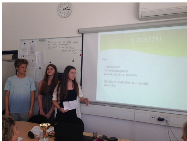
Analizo NPZ 2015 so pripravili in predstavili kar učenci 9. razreda

Dosežki učenca so izraženi v točkah in odstotkih. Vpišejo se v obvestilo o dosežkih pri nacionalnem preverjanju znanja, ki je priloga k spričevalu 6. razreda oziroma k zaključnemu spričevalu 9. razreda (vir: Pravilnik o nacionalnem preverjanju znanja v osnovni šoli (Ur.l. RS, št. 30/2013)).