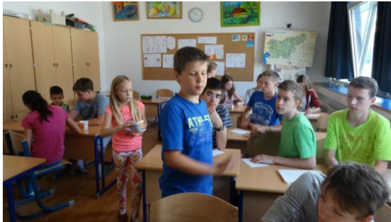
Tretješolci s pomočjo Montessori materiala osmošolcem razlagajo kvadratne korene

V šolskem letu 2015/2016 bo pouk v manjših učnih skupinah potekal le v 8. in 9. razredu, in sicer pri matematiki in angleščini. Pouk v štirih manjših učnih skupinah bomo izvajali kot kombinacijo 3. ravni zahtevnosti s heterogenimi učnimi skupinami.