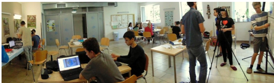
Ustvarjalne delavnice za nadarjene učence v Fiesi

Dodatni pouk je namenjen učencem z boljšim učnim uspehom, ki pri posameznih predmetih presegajo standarde znanja. S poglobljenimi in razširjenimi vsebinami ter z različnimi metodami dela, kot so samostojno učenje, problemski pouk in priprava na tekmovanja, podpira doseganje višjih učnih ciljev. Učencem, ki poleg rednega pouka potrebujejo še dopolnilno razlago snovi in pomoč učitelja, je namenjen dopolnilni pouk . V manjši skupini in z drugačnim načinom dela učenci lažje osvojijo minimalne učne standarde.