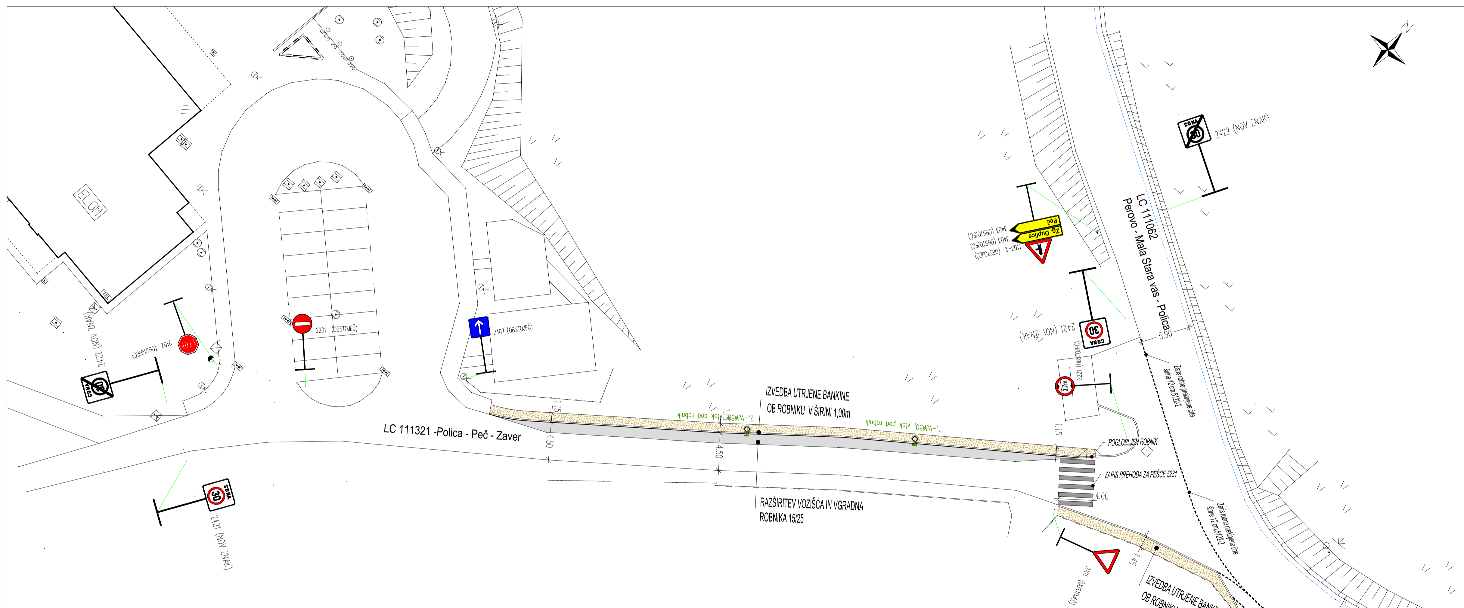
LC 111321 Polica - Peč - Zaver