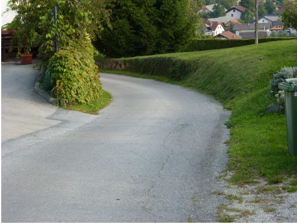
Nepregleden ovinek iz Bliske vasi proti Polici