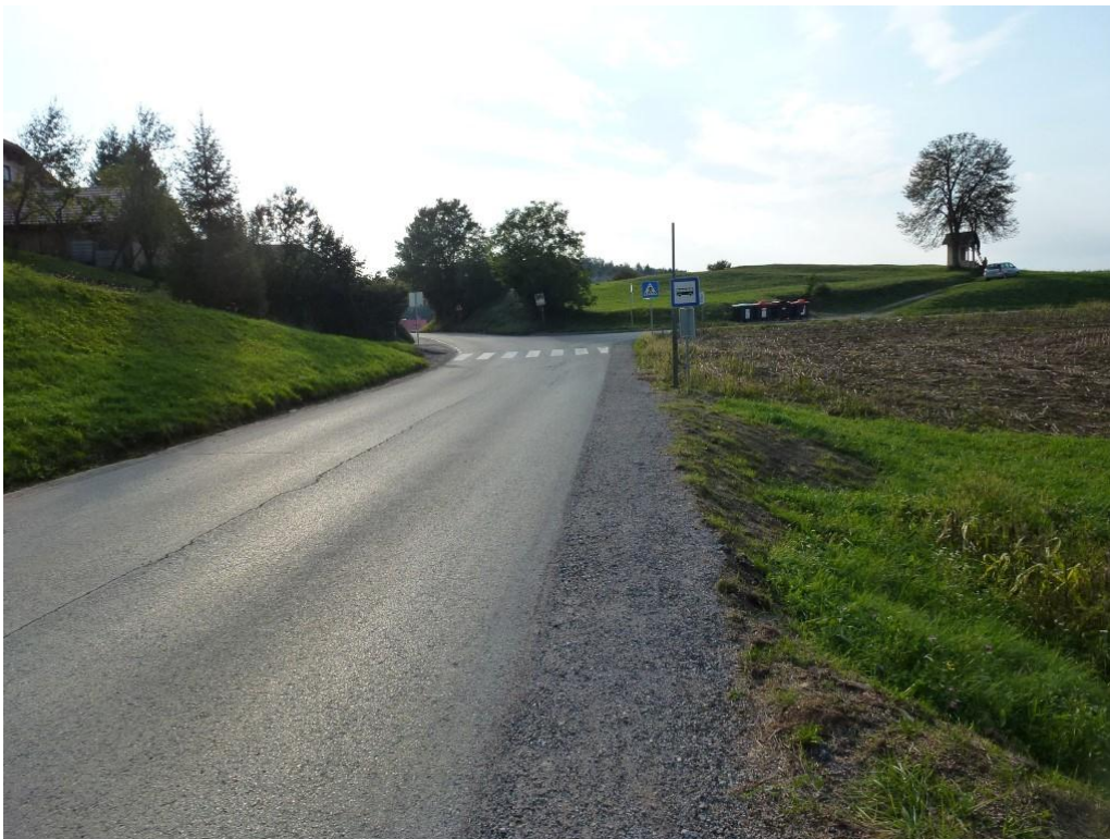
Ni pločnika, ni robnih črt