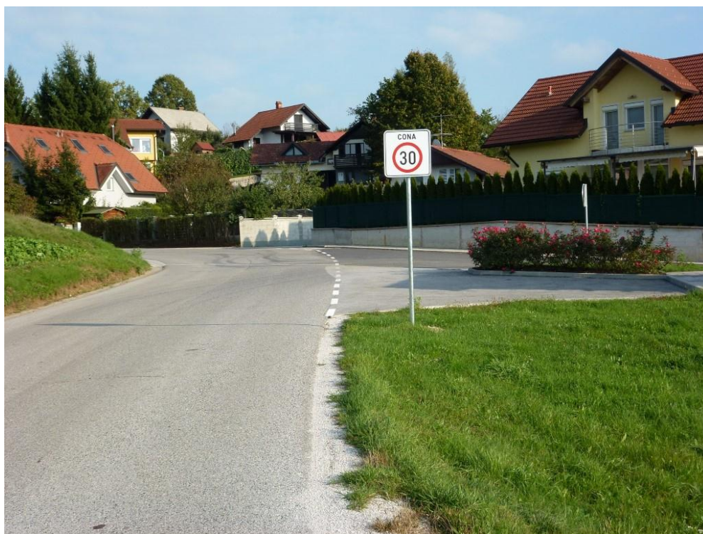
Nepregleden ovinek pred šolo