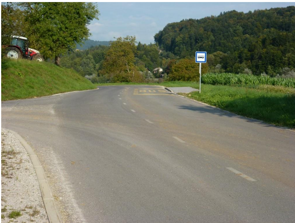
Ni prehoda za pešce, ni avtobusnega postajališča, nepregleden ovinek