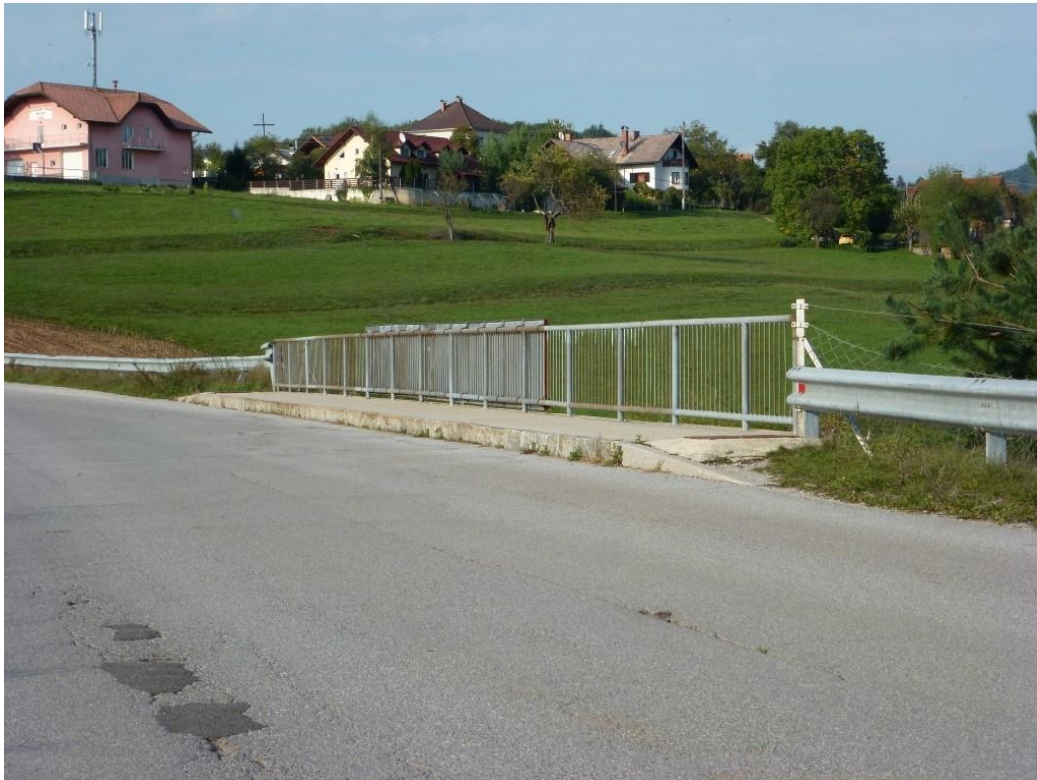
Nezavarovana ograja na nadvozu avtoceste