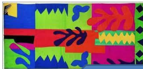
VINSKA STISKALNICA, 1951

Avtor teh slik je francoski slikar Henri Matisse (1869–1954), ki je znan po domiselni uporabi barv in velja za enega največjih umetnikov 20. stoletja. Slikal je tudi z uporabo tehnike kolaž - s tempero je barval kartončke, jih izrezoval in lepil na slike.