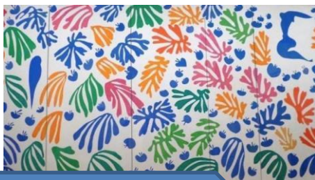
PAPIGA IN MORSKA DEKLICA, 1952