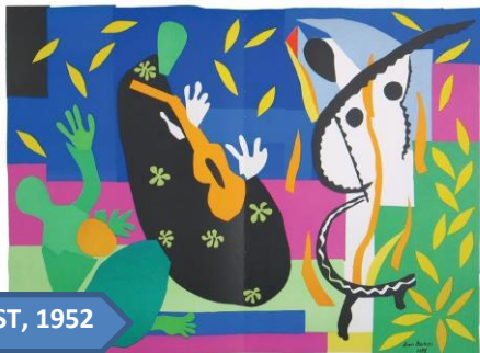
KRALJEVA ŽALOST, 1952

Opazuj spodnja likovna dela. Kaj vse opaziš? Kaj misliš, da predstavljajo? Na kakšen način misliš, da jih je avtor ustvaril?