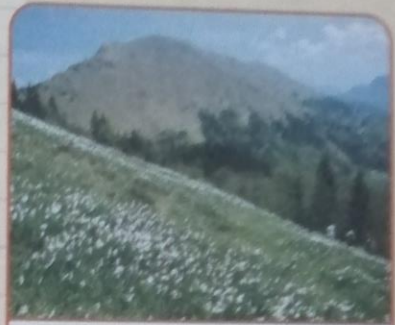
Gora v Karavankah, znana po narcisah.