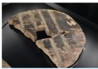
Del kolesa, najdenega na Ljubljanskem barju

Zadnja leta naša sodobna družba pušča vse več ne željenih sledi. Zaraščene kmetijske površine, intenzivno obdelane njive, črne gradnje in kupi odpadkov dnevno slabšajo ohranjenost naravnega okolja in kakovost bivanjskega prostora prebivalcev.