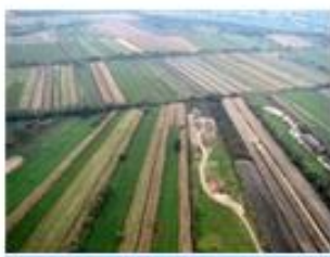
Barje - danes predvsem kmetijske površine

Območje Barja je tudi pomembno arheološko najdišče zaradi kolišč in koliščarjev . Tukaj so leta 2002 našli najstarejše kolo na svetu. Razstavljeno je v Mestnem muzeju in naj bi bilo staro okrog 5 200 let. Ohranilo se je, ker je tičalo v vlažnem blatu, ki ni dopuščalo, da bi prišlo v stik z zrakom in zgnilo.