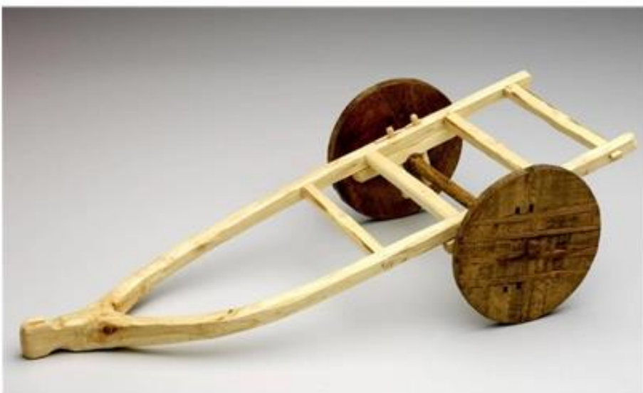
Rekonstrukcija voza

Posebno pozornost je vzbudila izjemna najdba diskastega kolesa z osjo, ki so ga arheologi odkrili zgodaj spomladi leta 2002 na območju kolišča na naselbini Stare Gmajne na jugozahodu Ljubljanskega barja. Kolo je sestavljeno iz dveh debelih jesenovih desk in štirih vrinjenih grebenastih hrastovih letev. Os iz hrastovine je bila prvotno toga zasidrana v kolesu, kar pomeni, da se je pri vožnji prav tako vrtela. Kolo in os spadata k dvokolesnemu vozu. Na podlagi analiz je starost kolesa in osi ocenjena na okoli 5 200 let. Detajli dokazujejo, da je najdbo izdelal vrhunski prazgodovinski kolar.