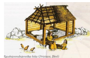
Zgodnje srednjeveška hiša (Pristava, Blejski otok)