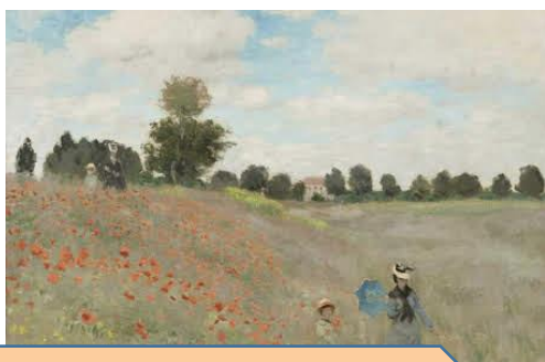
CLAUDE MONET, MAKOVO POLJE, 1897

Cvetoče travnike slikarji pogosto upodobijo v svojih umetniških delih. Najdemo jih tudi med deli znanih slikarjev, kot sta francoski slikar Claude Monet in avstrijski slikar Gustav Klimt.