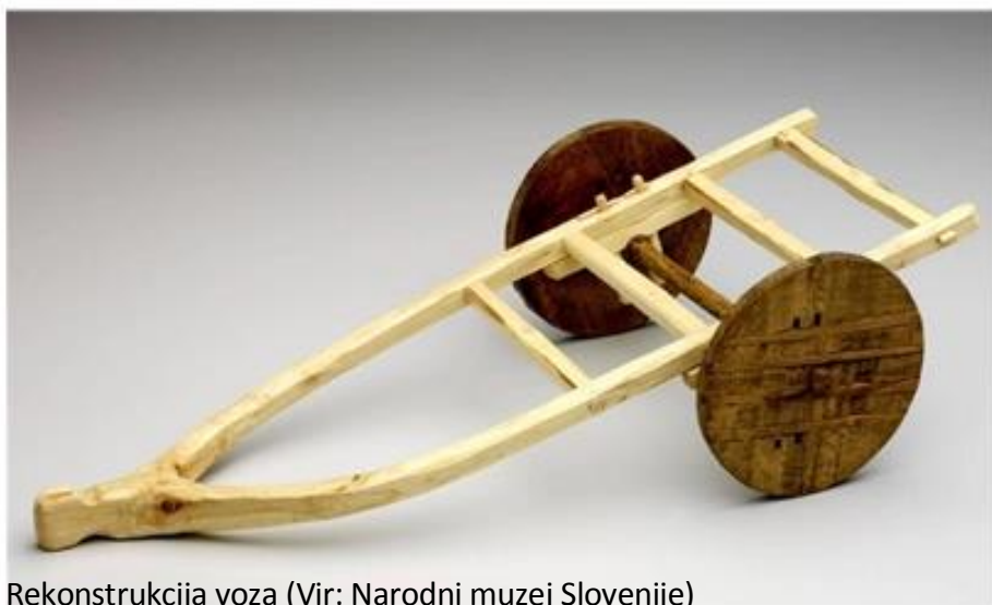
Rekonstrukcija voza

Posebno pozornost je vzbudila izjemna najdba diskastega kolesa z osjo, ki so ga arheologi odkrili zgodaj spomladi leta 2002 na območju kolišča na naselbini Stare Gmajne na jugozahodu Ljubljanskega barja. Kolo je sestavljeno iz dveh debelih jesenovih desk in štirih vrinjenih grebenastih hrastovih letev. Os iz hrastovine je bila prvotno togo zasidrana v kolesu, kar pomeni, da se je pri vožnji prav tako vrtela. Kolo in os spadata k dvokolesnemu vozu. Na podlagi analiz je starost kolesa in osi ocenjena na okoli 5 200 let. Detajli dokazujejo, da je najdbo izdelal vrhunski prazgodovinski kolar.