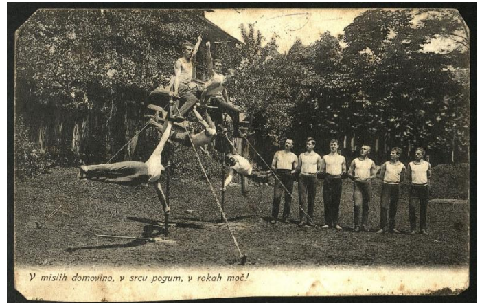
Telovadno društvo Orel

V 20. letih 20. stoletja (v času ko so ZDA doživele zlata 20. leta in gospodarsko krizo, v času, ko je bil primorski del slovenskega ozemlja del Italije) je Leon Štukelj v orodni telovadbi osvojil kar tri olimpijske medalje, potem pa še dve leta 1936 (v letu, ko se je začela španska državljanska vojna).