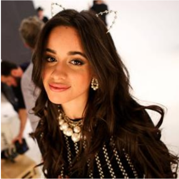
Slika 3 – jesenski tip