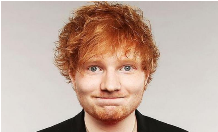
Slika 4 – jesenski tip