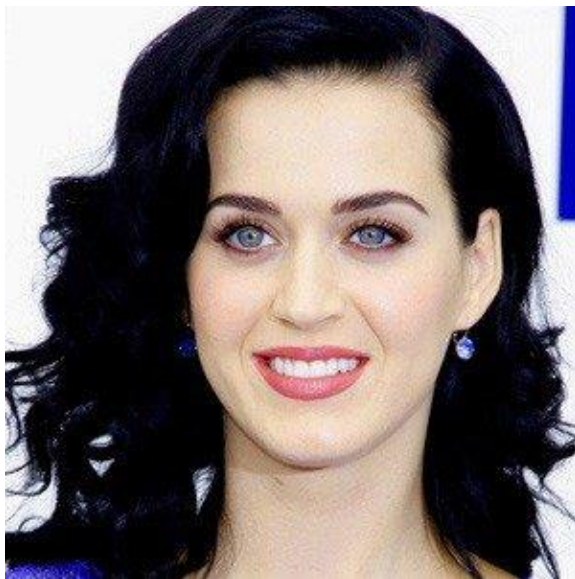
Slika 6 – zimski tip