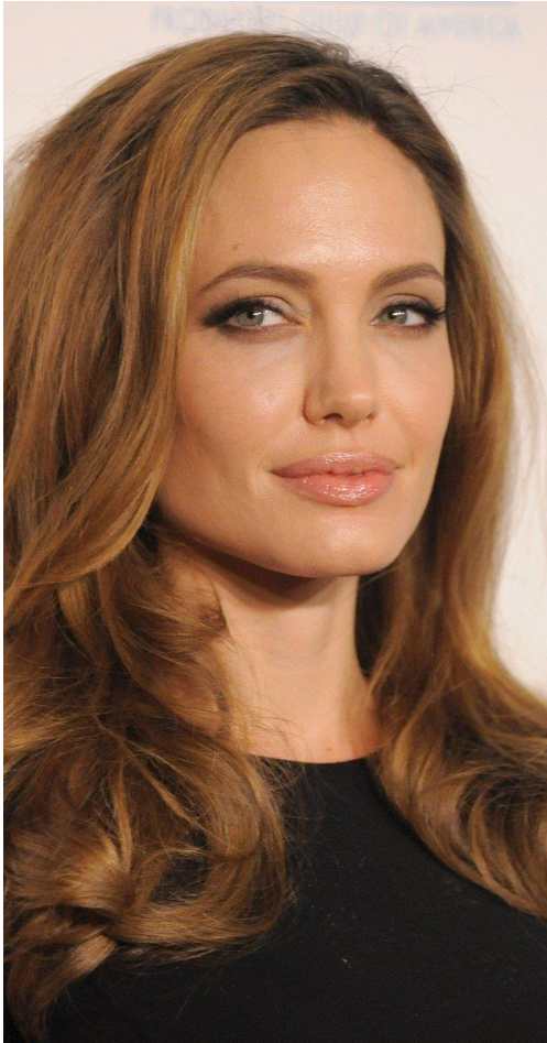
Slika 2 – poletni tip