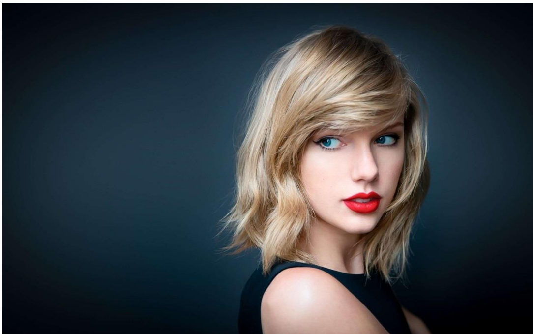
Slika 1 – pomladni tip