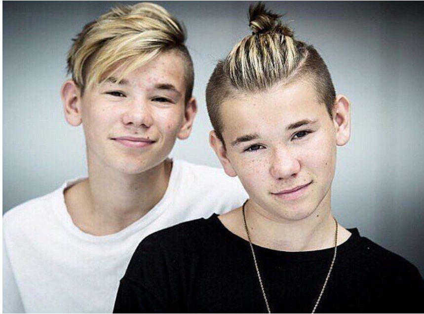
Slika 5 – zimski tip